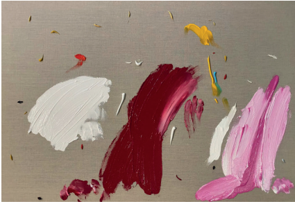
La capital de la capital, 2021

Acrílico sobre tela 59.4 x 84.1 x 4 cm (23.39 x 33.11 x 1.57 in.)