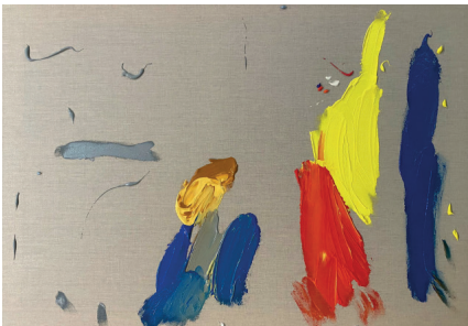
La contracción económica, 2021

Acrílico sobre tela 59.4 x 84.1 x 4 cm (23.39 x 33.11 x 1.57 in.)