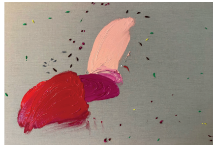
La sobrina de Letizia, 2021

Acrílico sobre tela 59.4 x 84.1 x 4 cm (23.39 x 33.11 x 1.57 in.)