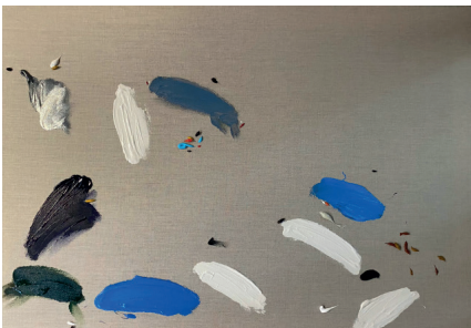
Respecto a la diversidad, 2021

Acrílico sobre tela 59.4 x 84.1 x 4 cm (23.39 x 33.11 x 1.57 in.)