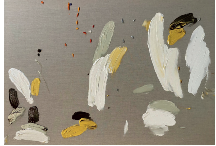
Regalos de más de 48 dólares, 2021

Acrílico sobre tela 59.4 x 84.1 x 4 cm (23.39 x 33.11 x 1.57 in.)