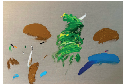
La percepción del peligro,, 2021

Acrilico sobre tela 59.4 x 84.1 x 4 cm (23.39 x 33.11 x 1.57 in.)