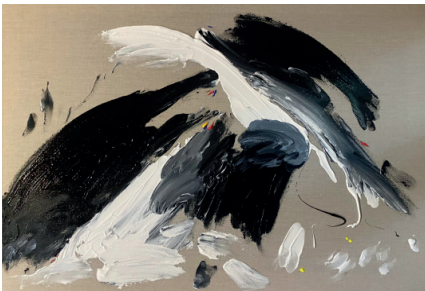
Cubana en busca de Tokio, 2021

Acrilico sobre tela 59.4 x 84.1 x 4 cm (23.39 x 33.11 x 1.57 in.)