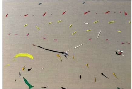
Lo mejor está por venir, 2021

Acrilico sobre tela 59.4 x 84.1 x 4 cm (23.39 x 33.11 x 1.57 in.)