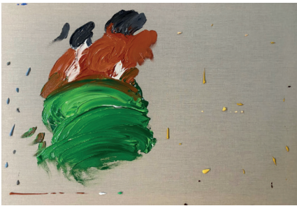
Plato de orejas, 2021

Acrilico sobre tela 59.4 x 84.1 x 4 cm (23.39 x 33.11 x 1.57 in.)