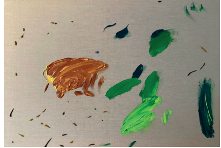
Fiebre amarilla, 2021

Acrílico sobre tela 59.4 x 84.1 x 4 cm (23.39 x 33.11 x 1.57 in.)