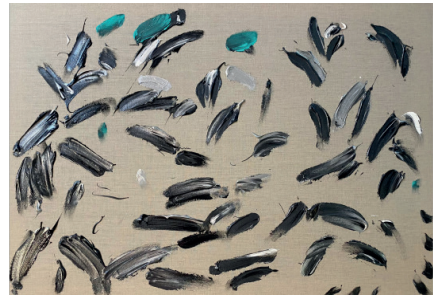
El uranio, 2021

Acrílico sobre tela 59.4 x 84.1 x 4 cm (23.39 x 33.11 x 1.57 in.)