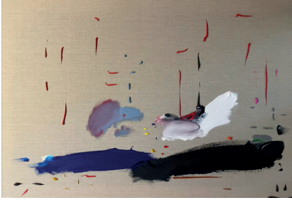
Crudo en el océano, 2021

Acrílico sobre tela 59.4 x 84.1 x 4 cm (23.39 x 33.11 x 1.57 in.)