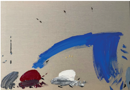
El fenómeno, 2021

Acrílico sobre tela 59.4 x 84.1 x 4 cm (23.39 x 33.11 x 1.57 in.)