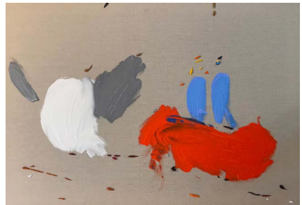
Los ridículos candidatos, 2021

Acrílico sobre tela 59.4 x 84.1 x 4 cm (23.39 x 33.11 x 1.57 in.)