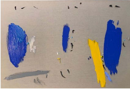
Un recorte de empleos y cierre de oficinas 2021

Acrílico sobre tela 59.4 x 84.1 x 4 cm (23.39 x 33.11 x 1.57 in.)