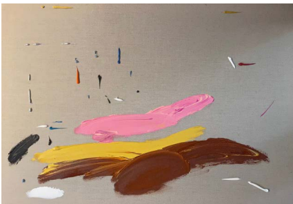
Récord global, 2021

Acrílico sobre tela 59.4 x 84.1 x 4 cm (23.39 x 33.11 x 1.57 in.)