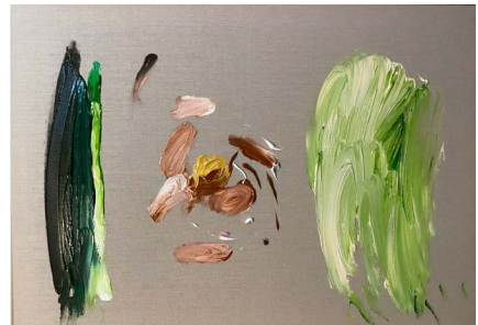
Cuatro tigres de Bengala en La Habana, 2021

Acrilico sobre tela 59.4 x 84.1 x 4 cm (23.39 x 33.11 x 1.57 in.)