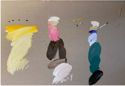
Todo para asestar, 2021

Acrilico sobre tela 59.4 x 84.1 x 4 cm (23.39 x 33.11 x 1.57 in.)