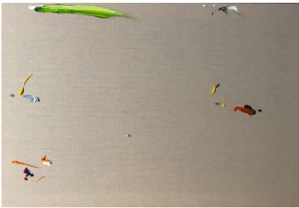
Fuerte accidente de Martín, 2021

Acrilico sobre tela 59.4 x 84.1 x 4 cm (23.39 x 33.11 x 1.57 in.)