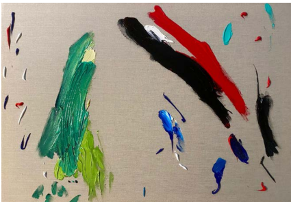
Un mambí, 2021

Acrilico sobre tela 59.4 x 84.1 x 4 cm (23.39 x 33.11 x 1.57 in.)