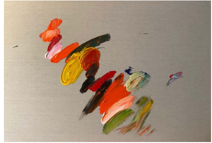
La clasificación en vivo, 2021

Acrilico sobre tela 59.4 x 84.1 x 4 cm (23.39 x 33.11 x 1.57 in.)