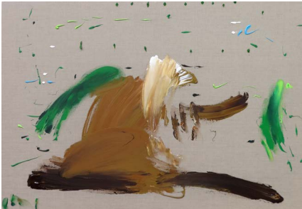
Un baile de TikTok, 2021

Acrilico sobre tela 59.4 x 84.1 x 4 cm (23.39 x 33.11 x 1.57 in.)