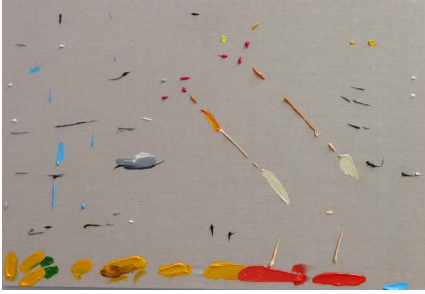
Alquileres de Berlín 2021

Acrilico sobre tela 59.4 x 84.1 x 4 cm (23.39 x 33.11 x 1.57 in.)