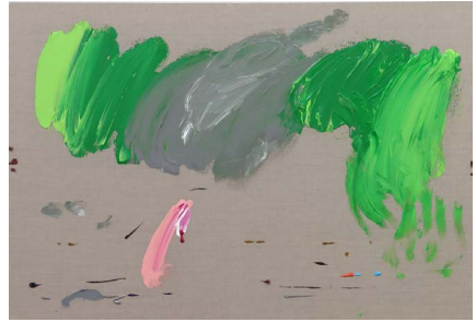
París, Estocolmo y Barcelona, 2021

Acrilico sobre tela 59.4 x 84.1 x 4 cm (23.39 x 33.11 x 1.57 in.)