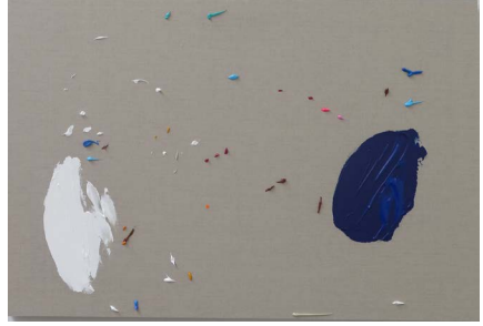
Los temores de Occidente, 2021

Acrilico sobre tela 59.4 x 84.1 x 4 cm (23.39 x 33.11 x 1.57 in.)