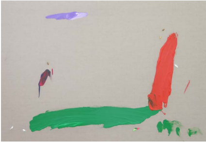
Casi ser el héroe, 2021

Acrilico sobre tela 59.4 x 84.1 x 4 cm (23.39 x 33.11 x 1.57 in.)