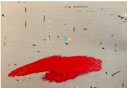
Capital de multimillonarios, 2021

Acrilico sobre tela 59.4 x 84.1 x 4 cm (23.39 x 33.11 x 1.57 in.)